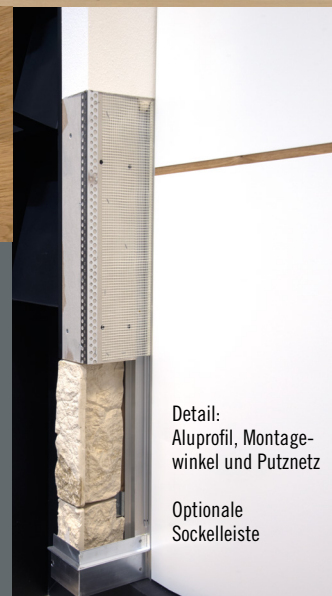
Detail: Aluprofil, Montage- winkel und Putznetz