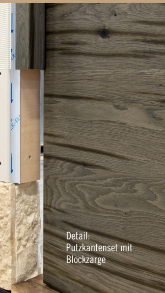
Detail: Putzkantenset mit Blockzarge