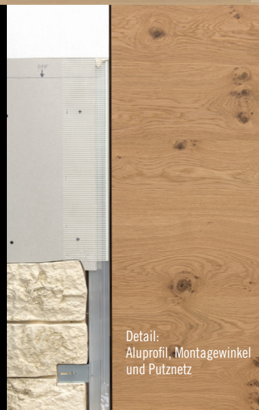
Detail: Aluprofil, Montagewinkel und Putznetz